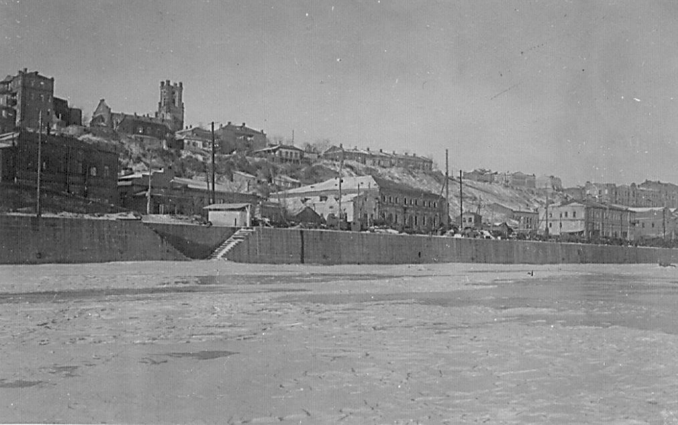
АДЛС Ф.Р. – 627.Оп.1л. Д.1Л.1.

Уже с 20-го февраля 1943 года, спустя лишь шесть дней с даты освобождения Ростова-на-Дону от немецко-фашистских захватчиков, стал функционировать Ростовский-на-Дону Холодильник Главхладпрома Народного комиссариата мясной и молочной промышленности СССР. Работники приступили к восстановительным работам (Приказ от 20.02.1943 г. № 1 и.о. директора фабрики). О напряженном героическом труде коллектива рассказывают архивные документы (Ф.Р.-627,оп.1-л).